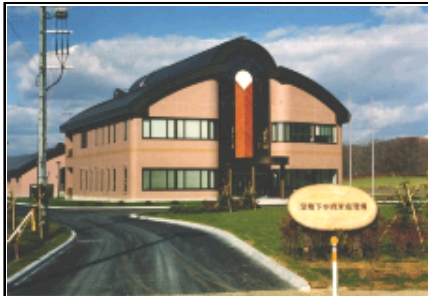
足寄下水終末処理場