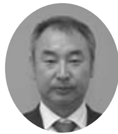
北2条4丁目 昭和42年8月2日生 無所属 当選3