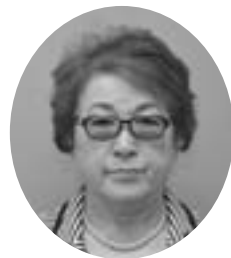
南5条5丁目 昭和18年5月1日生 公明党 当選5