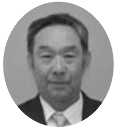
上利別23-5 昭和33年12月25日生 無所属 当選1