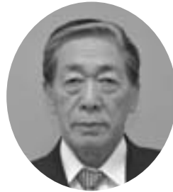
生 1947年3月11日 登 476 昭 和 21年3月11日 所 無 所属