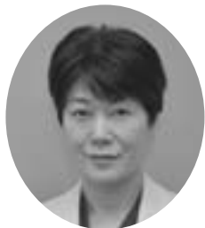
北4条1丁目 昭和36年11月13日生 無所属 当選1