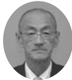
西町6丁目 昭和32年12月11日生 無所属 当選1