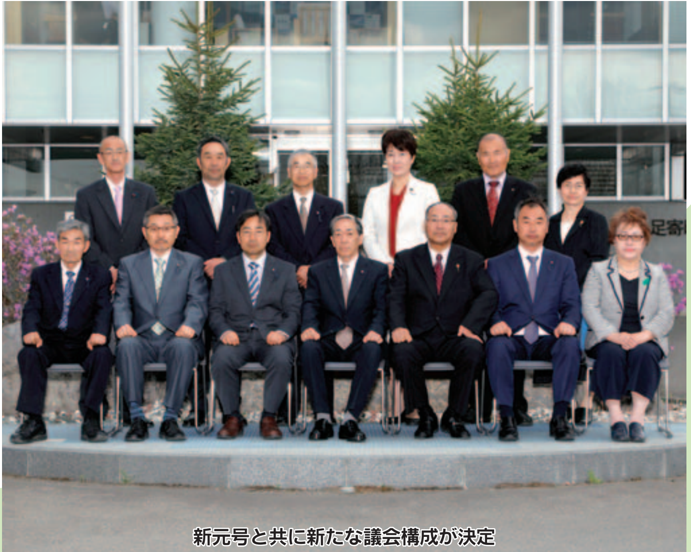
新元号と共に新たな議会構成が決定