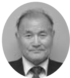
中矢272 昭和21年11月6日生 無所属 当選6