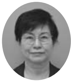
南3条1丁目 昭和22年3月8日生 無所属 当選5