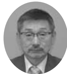
北2条3丁目 昭和27年2月22日生 無所属 当選2