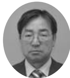
南4条5丁目 昭和29年5月1日生 無所属 当選2