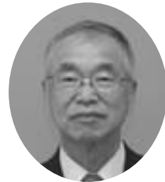
旭町3丁目 昭和24年8月5日生 日本共産党 当選3