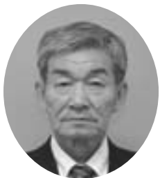
螺湾本町67 昭和21年11月30日生 無所属 当選4