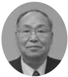
南6条7丁目 昭和21年10月25日生 無所属 当選5