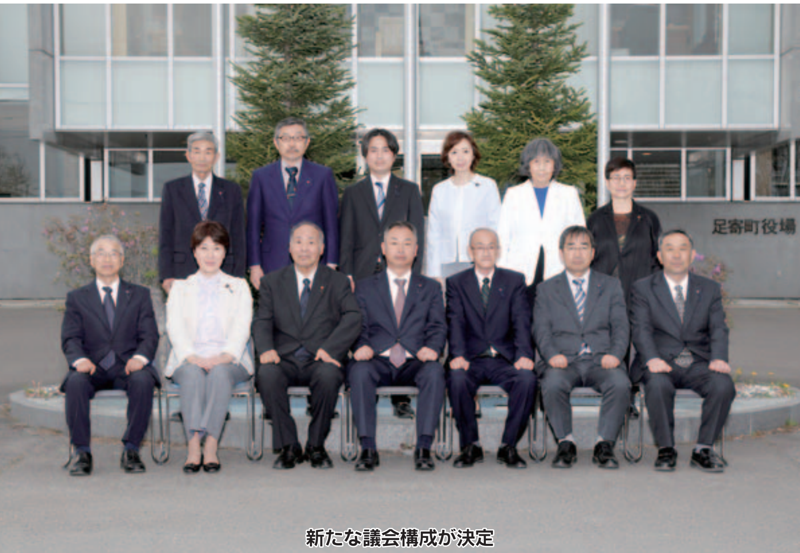
新たな議会構成が決定