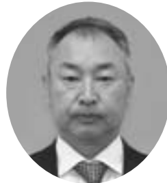
北2条4丁目 昭和42年8月2日生 無所属