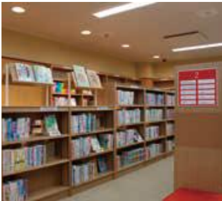
児童図書も充実しています

図書館では、小中学校の夏休み期間に合わせて「北海道青少年のための200冊」の中から、夏休みにおすすめの図書を展示します。また、第65回「青少年読書感想文コンクール課題図書」も展示しますのでご利用ください。