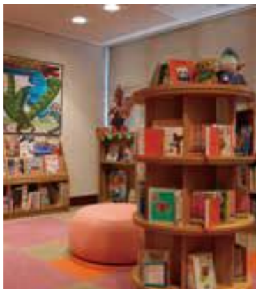
本を返すの忘れてませんか