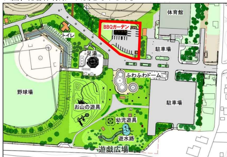
図1 里見が丘 バーベキューガーデン位置図