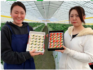
左がピュアスノー(白)、右がS・アマン

夏期の高温下でも高い糖度がある、香りが強い、外観が美しく切ったときに中身まで赤いという特性があります。甘くて赤くておいしいイチゴを是非お召し上がりください(Aコープ・道の駅等で販売)