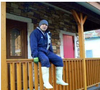
省エネで快適な自宅(非公開)