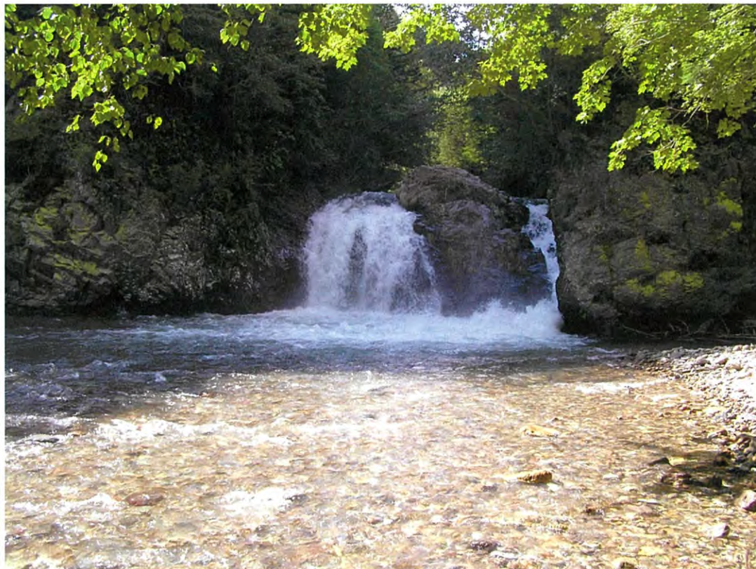
【写真：足寄町芽登 おおいわ 巨岩の滝】