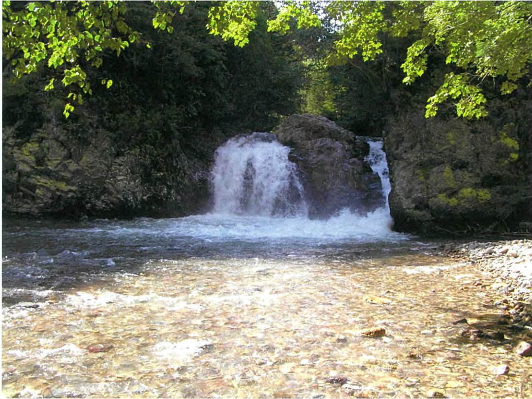
【写真：足寄町芽登 おおいわ 巨岩の滝】