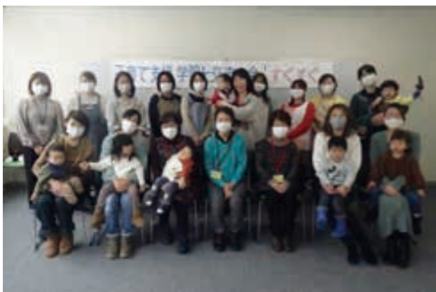
令和2年度「すくすく」閉講式