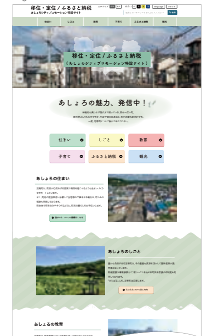
※画像はサンプルです