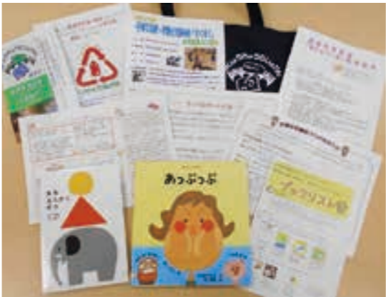
ブックスタートパック

ブックスタート事業では、乳児検診時に読み聞かせをし、ブックスタートパックを配布しています。 ※ブックスタートは、本町で育つ全ての赤ちゃんが絵本を通して「あたたかくて楽しいことばのひととき」を持つことを応援するものです。 本年度のブックスタートでプレゼントする絵本が決まりました。