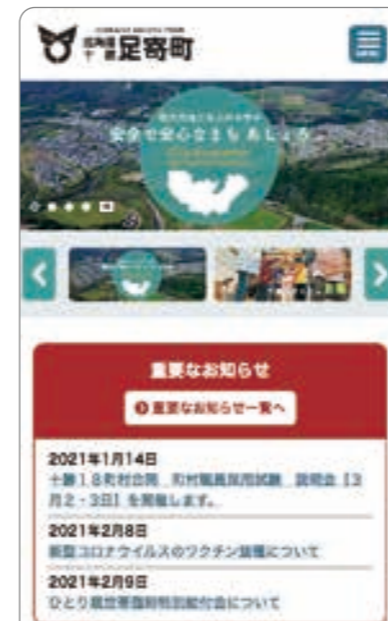
※画像はサンプルです