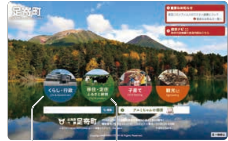
※画像はサンプルです

ホームページにアクセスすると最初に総合トップと呼ばれるページが表示されます。ページ内には主に町民向けの情報を掲載する「くらし・行政情報」と「移住・定住、ふるさと納税」「子育て」「観光(観光協会サイト)」の各サブサイトへのリンクが設置されているため、目的のページに辿り着きやすくなっています。