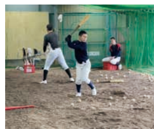
上利別多目的室内運動場での冬期練習

『冬に鍛える心と体』 11月〜3月の約半年間、北海道の高校野球は屋外で練習することができないオフシーズンとなります。