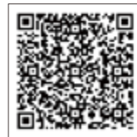
町ホームページ 都市計画変更について

都市計画変更の詳細は、町ホームページでも確認ができます。変更図書について不明な点は役場建設課管理都市計画担当にお尋ねください。