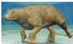
海の中で暮らしていたアシヨロア

アシヨロアやベヘモトプスは、東柱類の長い旅路の「生き証人」ならぬ「化石証人」なのです。