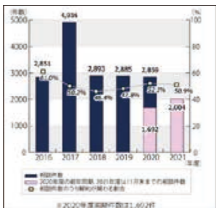
PI0-NETにおける「脱毛エステ」の相談件数

【ここがポイント②】 エステティックサービスに関するトラブルの多くは長期間の施術を前提とするコースで中途解約・精算をするときに発生しています。「通い放題」と説明されたのに実際には年間の利用回数が決まっていた予約が取れないといった苦情の他、高額な中途解約料を請求された、すでに受けた施術費用が高額に設定されていたために返戻金が少額であったという相談もあるようです。