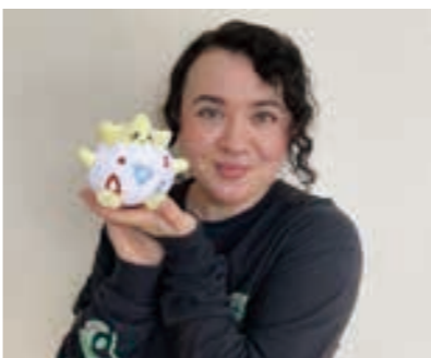
ジャスミンさんと「トゲピー」のぬいぐるみ

私も新しく発売されたポケモンを買いました！これからも私の大好きなゲームを通して、日本語の勉強を頑張ります。