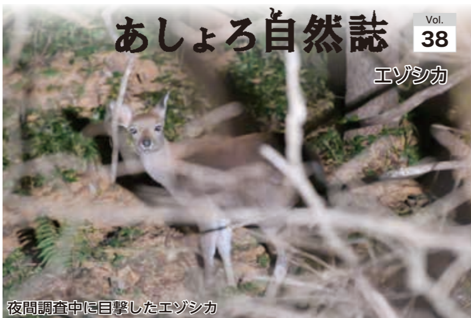
夜間調査中に目撃したエゾシカ

ニホンジカはシカ科シカ属の偶蹄類で、北海道から沖縄県慶良間諸島までの日本と、朝鮮半島および中国、台湾、ベトナム、ロシア沿海州に分布しています。エゾシカは北海道のみに生育するニホンジカの亜種です。シカ科の仲