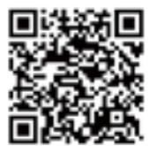
インターネットトラブル事例集

総務省では、実際に起きたトラブル事例を基に「インターネットトラブル事例集（2021年度版）」を作成しHPで掲載していますので活用ください。