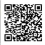
省エネ型製品情報サイト

また、エアコンや暖房機器などを買い替える際、商品の省エネ性能を知りたいときには、省エネラベルが参考になりますが、その見方や最新の製品情報などは「省エネ性能カタログ」で調べることができます。