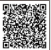
うちの人気者投稿フォーム