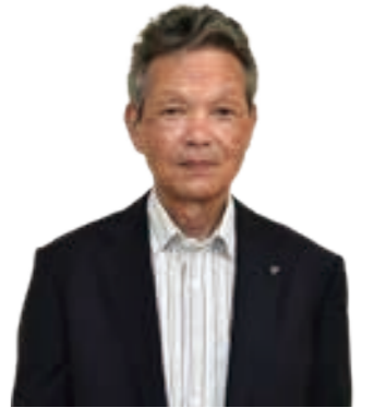
藤代和昭前教育長