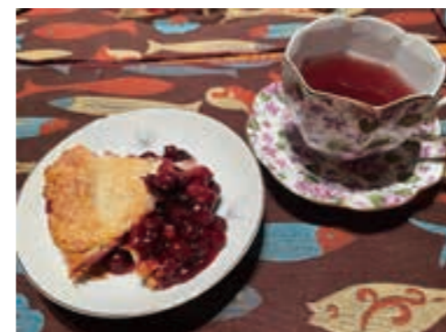
母特製のクランベリーパイ

ジャクソン家の定番メニューといえば、まず「ポークホックス&ザワークラウト」です。「ポークホックス」とは、豚の肉をオーブンでじっくり時間をかけて焼いて作る料理です。そして「ザワークラウト」はドイツ発祥のキャベツで作ったピクルスのことをいいます。それらをプレートに盛り付け、付け合わせにはマッシュポテトと焼いた野菜を添えて食べるのが定番の食べ方です。