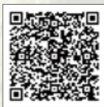
省エネ性能カタログ

また、エアコンや暖房機器などを買い替える際、商品の省エネ性能を知りたいときには、省エネラベルが参考になりますが、その見方や最新の製品情報などは「省エネ性能カタログ」で調べることができます。