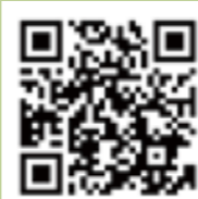
北海道陽性者登録センター

上記該当とならない方(65歳以上の方、重症化リスクのある方、重い症状のある方)は、医療機関を受診してください。なお、センターの対象者でも、医療機関受診を希望される場合は、受診が可能です(受診する場合は受診前に必ずかかりつけ医または健康相談センターへ連絡を入れてください)。