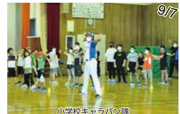
ファイターズダンスチャレンジ