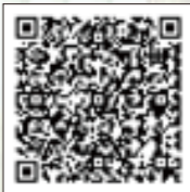
資源エネルギー庁HP 家庭でできる省エネ

家庭でできる省エネについては資源エネルギー庁のサイトにさまざまな事例が紹介されています。