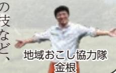
地域おこし協力隊 金根