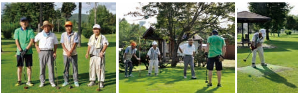
ときわパークゴルフ場にて