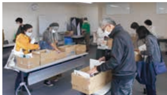
好評だった昨年のブックリサイクル