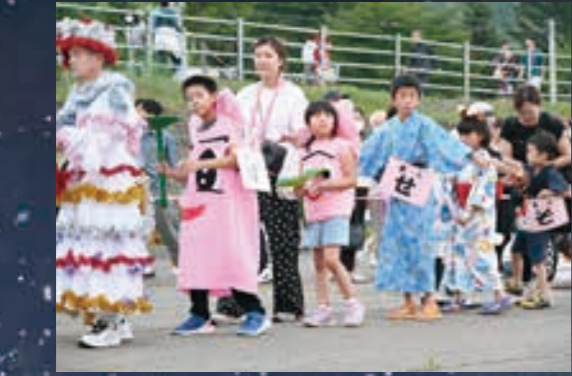
仮装盆踊り団体の部 優勝