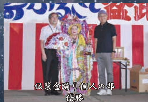
仮装盆踊り個人の部 優勝