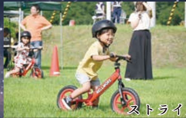
ストライダーレース