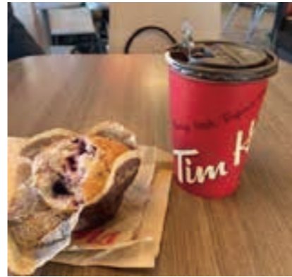
ティム・ホートンズのカナディアンダブルダブルコーヒーとマフィン

そして四つ目は、カナダ国内で展開しているコーヒーショップ「ティム・ホートンズ」の有名なカナディアンダブルダブル（クリーム2つと砂糖2つを混ぜたレギュラーコーヒー）とマフィンを食べることです。この2つが私の大好きな定番メニューです。もうすぐ、足寄高校の訪問団がウエタスキウィン市にやってきます。ここで高校生をお迎えできることもとても楽しみにしています。代表団の皆さんに私の故郷をたくさん紹介したいと思います！