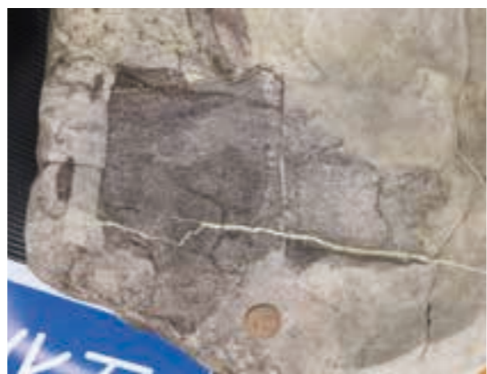
発見された大型のクジラの背骨の化石(横向き)