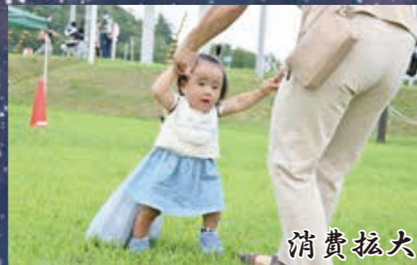
消費拡大牛乳レース