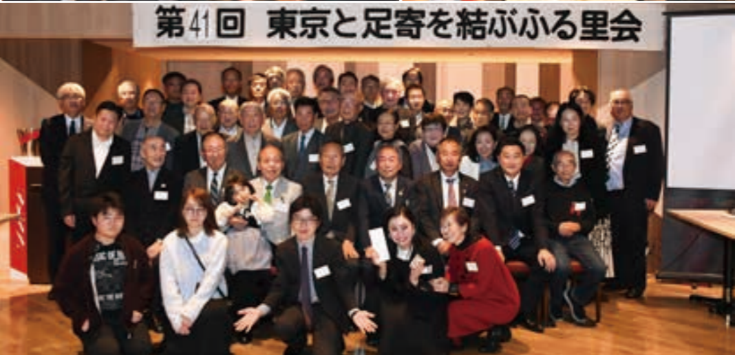
第41回 東京と足寄を結ぶふる里会