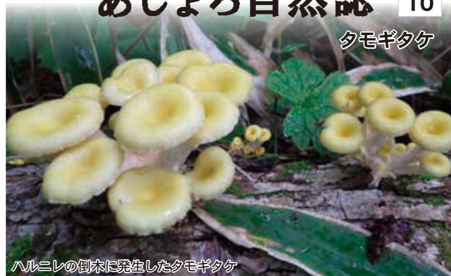
ハルニレの倒木に発生したタモギタケ

日本では北海道と東北地方に自生するヒラタケ属のキノコで、北海道においては古くから食用として親しまれてきました。味噌汁などの具材として美味であるだけでなく、鮮黄色の見た目は食卓を華やかにしてくれます。アイヌ語でチキサニカルシ(ハルニレに生