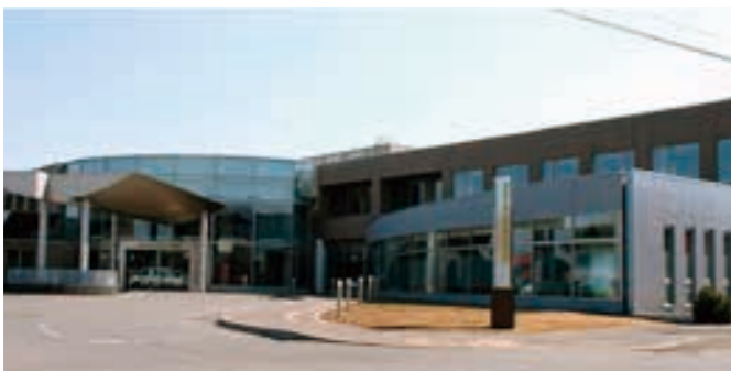
町国民健康保険病院