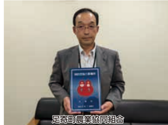
足寄町農業協同組合