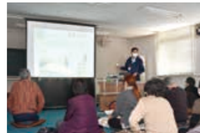
自治会での防災講話