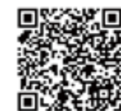
下水道いろいろコンクール

みなさんは「下水道の日」をご存じですか？ 「下水道の日」は、1961年に下水道の全国的な普及を図ることを目的に「全国下水道促進デー」として始まり、その後、2001年に親しみのある名称として「下水道の日」に変更されました。 「下水道の日」が9月10日であるのは、下水道の大きな役割の一つである雨水の排除を念頭に、台風シーズンを過ぎた220日（立春から数えて）が適当であるとされたことによります。 今年も、小学生から中学生を対象とした「下水道いろいろコンクール」（主催：公益社団法人日本下水道協会、株式会社日本水道新聞社）が開催されます。興味のある方は、参加してみたいはかがでしょうか！