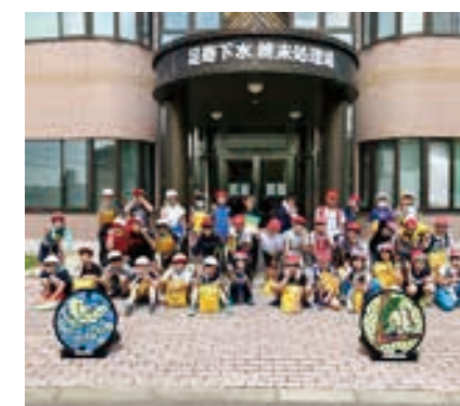
下水終末処理場見学