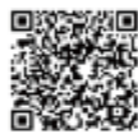
北海道 ダニ媒介感染症対策