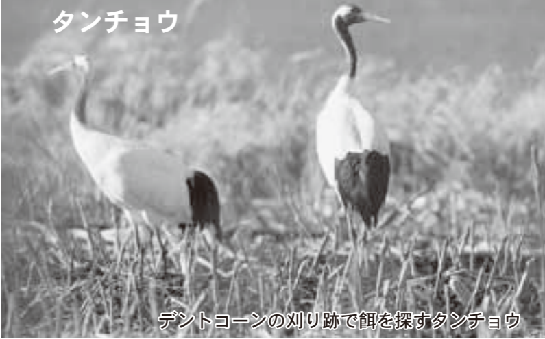
デントコーンの刈り跡で餌を探すタンチョウ