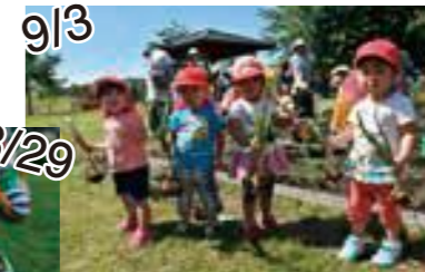
9/3 りす・うさぎ組（たまねぎ）