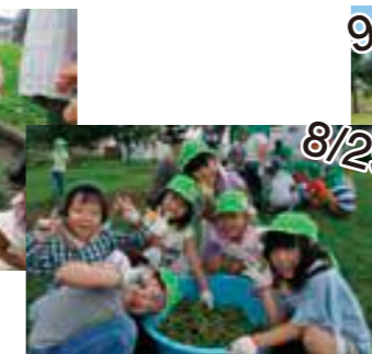
8/29 らいおん組（えだまめ）