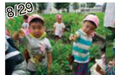
8/29 こあら組（にんじん）