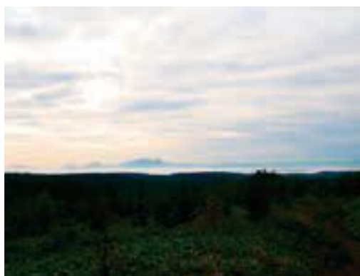
町内で撮影した雲海