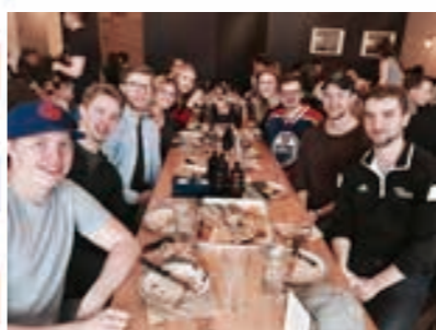
友達とのクリスマスパーティーの様子(2018年)

現在、ウエタスキウィン市には新型コロナウイルスの波が押し寄せてきています。11月には市内だけでも45人の感染者が確認されました。感染者が増えるにつれて、感染を予防するための制約も増えてきました。営業する店舗の数を減らしたり、1カ所に集ま