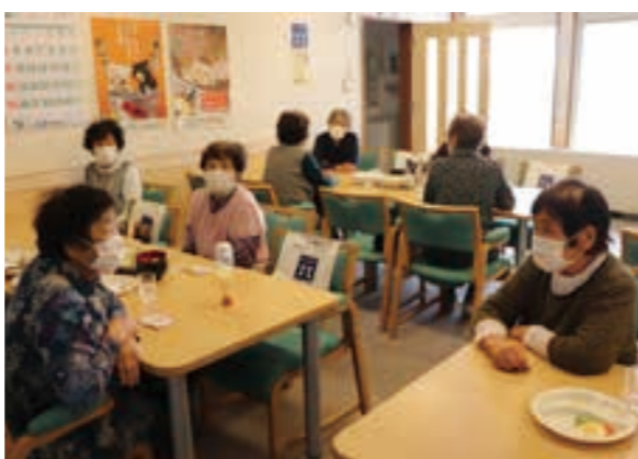
ほほえみ昼食会の様子