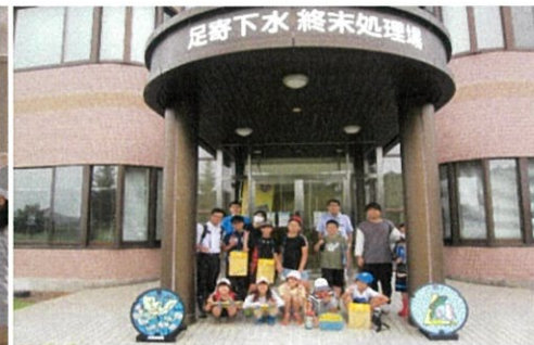
下水終末処理場前