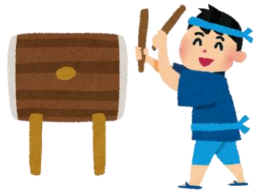
ジャパニーズ ドラム 和太鼓 【Japanese drum】