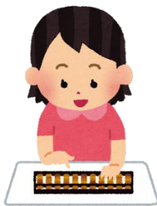
アバカス そろばん 【abacus】

アフター スクール アクティビティ 色々な習い事 【after school activity】