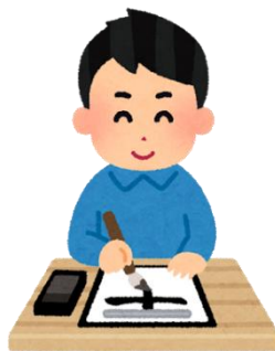
カリグラフィー 書道 【calligraphy】