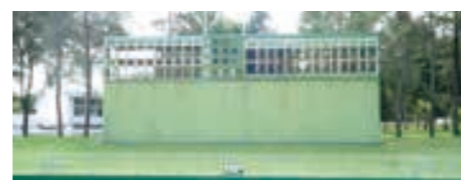
老朽化により改修されるスコアボード