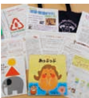
ブックスタートパック

開催日 10月28日(木) 時間 午前10時～正午 場所 町民センター多目的ホール 対象 乳児健診該当者 ※乳児健診時に読み聞かせをしブックスタートパックを配布する事業です。 詳細 図書館担当 ☎25-3189