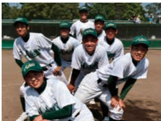
充実した高校野球生活を終えた3年生8人

今回選手たちは惜しくも敗戦となりましたが、これで人生が終わったわけではありません。大切なのはここに至るプロセスであり、そしてこの経験を今後の人生にどう生かしていくかだと考えます。 目標に向かってひたむきに頑張るこ