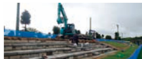
工事中のサッカー場

工事に伴う利用休止期間はありませんが、一部規制区域などが設けられていますのでご理解とご協力をよろしくお願いいたします。