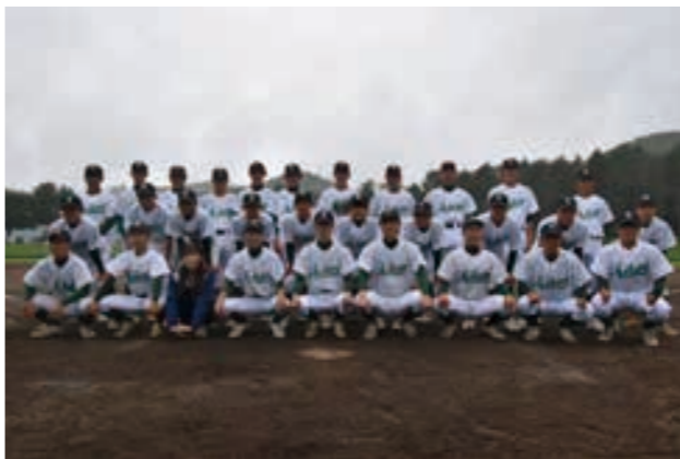
今年の野球部員は30人（マネージャー含む）