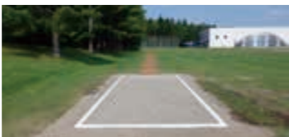
走り幅跳び跳躍施設