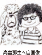
高島那生氏自画像

対象 図書館利用者カードをお持ちの方 ※一人1冊まで 詳細 図書館 ☎25-3189