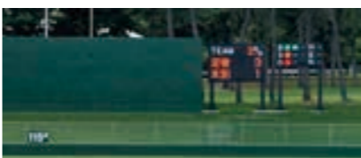
新しいスコアボード

陸上競技場に設置されている走り幅跳びの跳躍施設をリニューアルしました。陸上少年団や陸上部の練習が効果的に行えるようになりました。