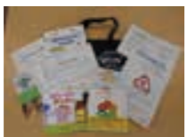
ブックスタートパック