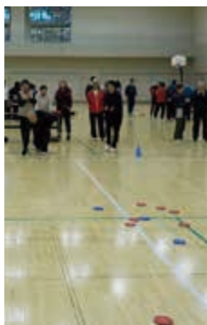
ニュースポーツ「ディスコン」

日時 12月20日(火) 1月24日(火) 2月28日(火) 3月28日(火) 午前10時～11時15分 場所 町民センター 生涯学習室 ☎25-3188