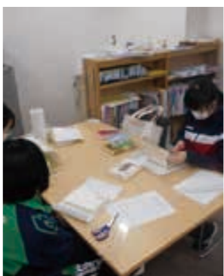
本の装備にチャレンジ