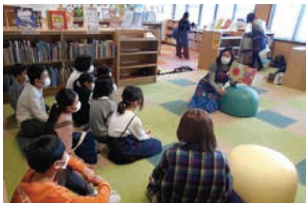
絵本の会「はらっぱ」

※おはなし「たんぼぼ」絵本の会「はらっぱ」で一緒に活動しませんか。興味のある方は、当日会場までお越しください。