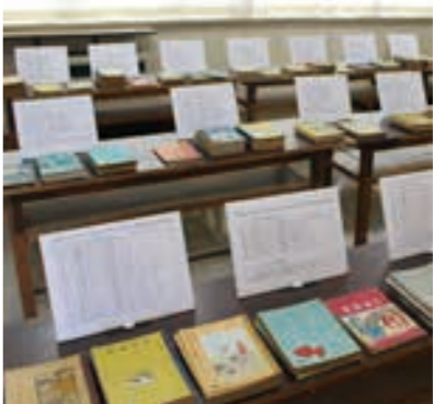
昔の教科書展示コーナー