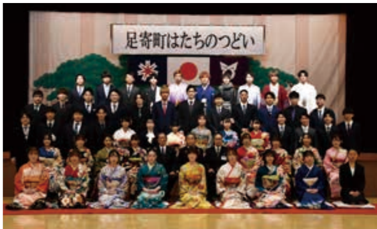
詳細 生涯学習室 ☎25-3188